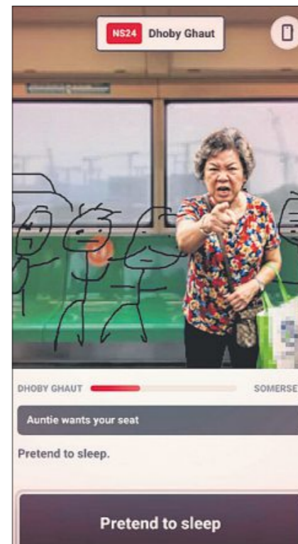
游戏中设有被安娣要求让位的环节，玩家此时就得装睡来“逃过一劫”。

玩家在游戏中会遭遇各种“挑战”——地铁突发故障、与其他人“抢座位”、被安娣要求让座……无一不让人会心一笑。有趣的是，如果玩家在游戏中“抢位”失败，就必须“站着”闯关。此时，现实中的手机必须维持在特定的手持角度，以模拟站立握着扶手的姿势，否则游戏