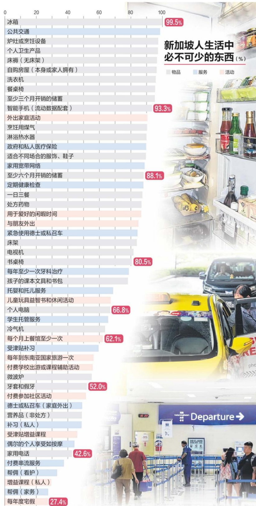
注 / 调查询问4014名年满19岁的本地公民和永久居民：“你认为这些项目是不是在本地过普通生活必需的？” 图表中所列的是表示赞同的受访者比率。制图 / 张进培