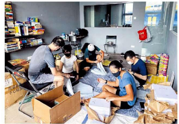
“齐望”运动的义工为活动包进行包装工作。

New Life Stories的志愿伙伴每周会到受惠者家中，为孩童讲故事，与他们互动。“不过，这些活动因疫情在3月暂停，我们得尽快地把一些活动转到线上，更得帮助没有电脑和网络设备的家庭解决这个问题，这不是一朝一夕能办到的。那段时间义工只能通过网络