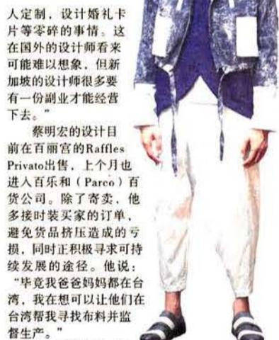
“Mr Howard”颇受本地潮男推崇。

“我只能在量不多的前提下坚持精做化作业，每一件衣服大小三个尺码，每个尺码最多5件，所以赚得很辛苦。我同时做一些兼职贴补，比如接私