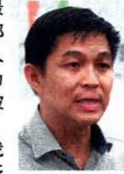
——陈川仁 (人力部副部长兼国家发展部高级政务部长)

现在国际竞争激烈, 就业保障自然成为新加坡人最关注的课题之一。这也是人力部把终身学习以及如何确保新加坡人在求职时获得公平对待, 设定为讨论议题的原因。这些是新加坡人能否在工作岗位上掌握机会, 并顺利发展事业的重要因素。我们的新加坡对话会收集到的广泛意见和反馈, 以及人力部定时举办的咨询活动将有助我们继续改进这方面的工作。