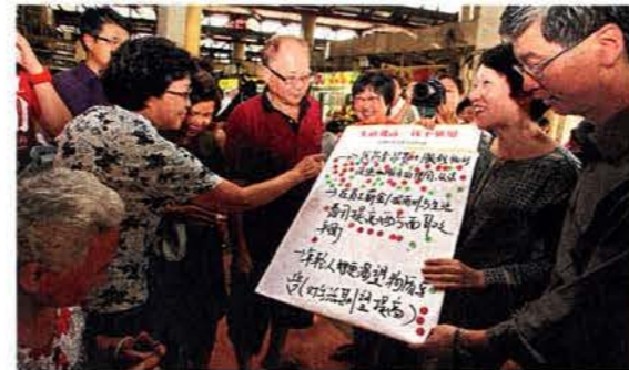
裕华区议员、总理公署部长兼环境及水源部兼外交部第二部长傅海燕 (右二) 去年10月参与了首场方言全国对话。(档案照片)

交通部从6月24日推行为期一年的非繁忙时段免费乘坐地铁试点计划, 以分散早上尖峰时段的人潮。如何提高公共交通系统的便利和素质是全国对话参加者最常讨论的课题。