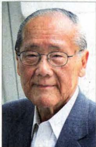
王康武教授因在教育和公共服务方面的杰出贡献而获颁功绩奖章。