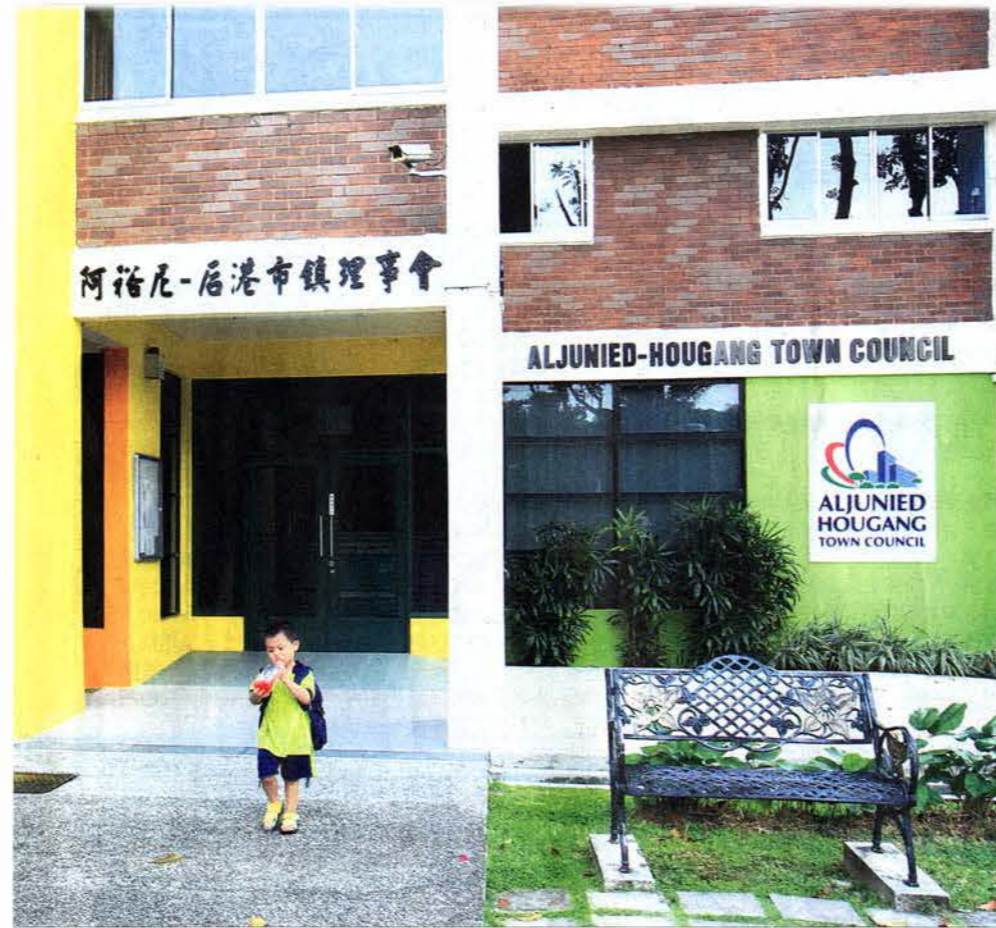
2011年大选后，阿裕尼-后港市镇会管理交接纠纷引发市镇会电脑管理系统所有权的争议，让不少人质疑公众利益是否受损。