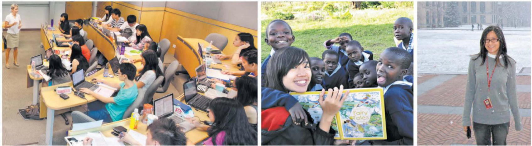
新大论坛形式课堂 - 成功实践互动式学习 (左), 非洲海外社区参与计划 - 新大学生Pendeza (中) 乐在其中, 国际学生交流计划开阔环球视野 (右)。

创新的教学理念、迎合行业所需的课程及环球视野，是造就新加坡管理大学毕业生超群出众、更胜一筹的个中关键