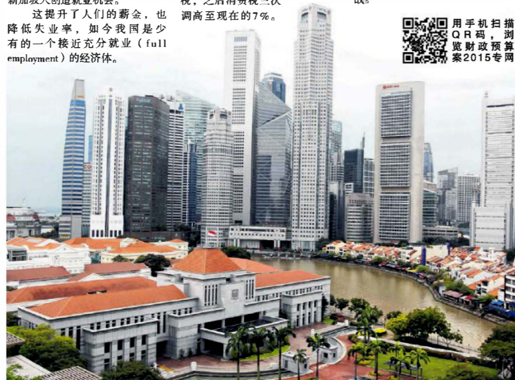
开放和低税率的环境是我国经济多年来快速发展的关键。

他说：“未来加入劳动队伍的人数会减少，缴税的人口也会减少，而引进外籍员工在目前的环境下是个非常敏感的课题，这将给政府未来的财政收入带来新挑战。”