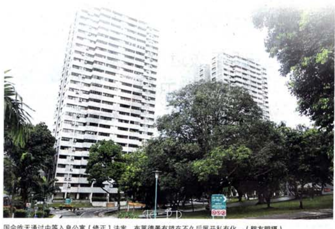
国会昨天通过中等入息公寓（修正）法案，布莱德景有望在不久后展开私有化。

此外，布莱德景管理公司也能动用公积金（sinking fund）填补地契差价，不过管理公司须召开业主大会，公开说明动用公积金，并由屋主投票通过。